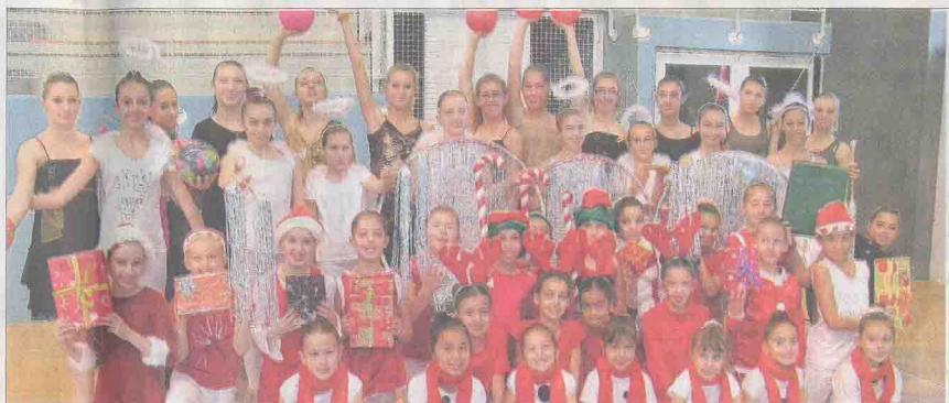
Les gymnastes de la GRBJ, entre deux passages notés, ont proposé une belle chorégraphie en tenues d'ange et de lutins.